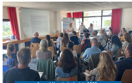
Assemblée générale, juin 2023 Auberge Ostal Morlaix

Le réseau se réunit en groupes de travail thématiques (Lab'UNAT, Envies d'Ouest, ...).